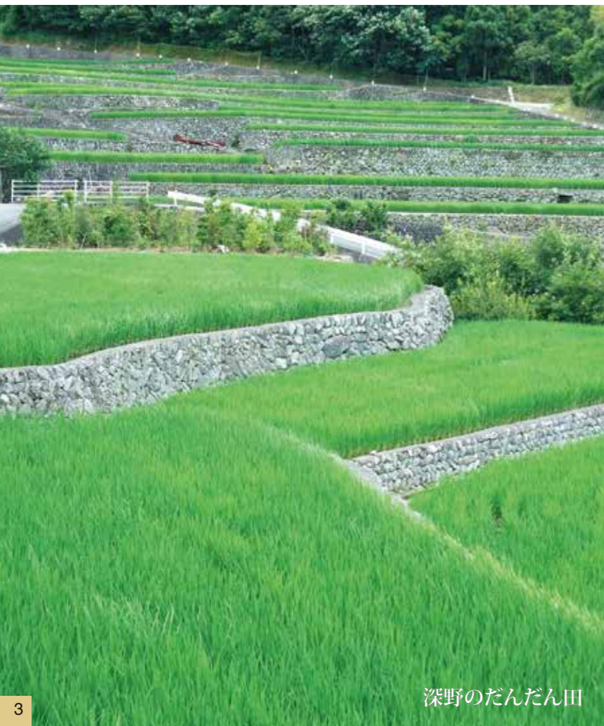
深野のだんだん田